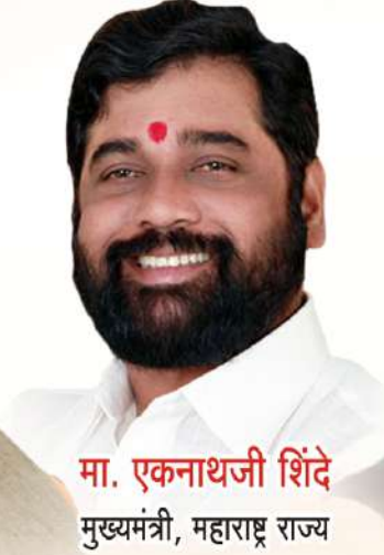
मा. एकनाथजी शिंदे मुख्यमंत्री, महाराष्ट्र राज्य