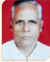
कंगळे महावीर भगवान