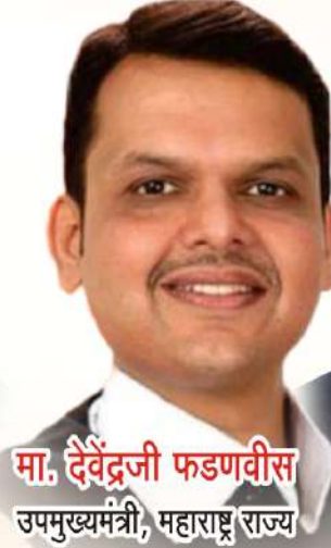
मा. देवेंद्रजी फडणवीस उपमुख्यमंत्री, महाराष्ट्र राज्य