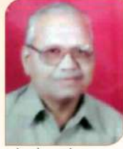
इंद्रापुणे रामचंद्र लक्ष्मण