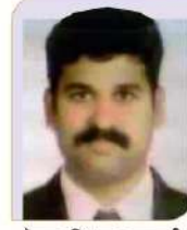
मेहता विशाल बाहुबली