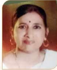
सागर शोभना विलास