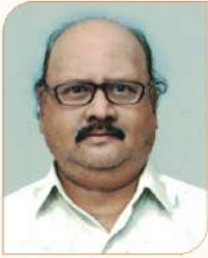
उपाध्यक्ष महावीर श्री. गुंडाळे