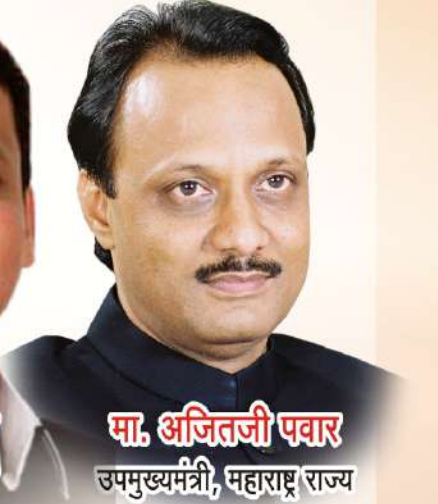
मा. अजितजी पवार उपमुख्यमंत्री, महाराष्ट्र राज्य