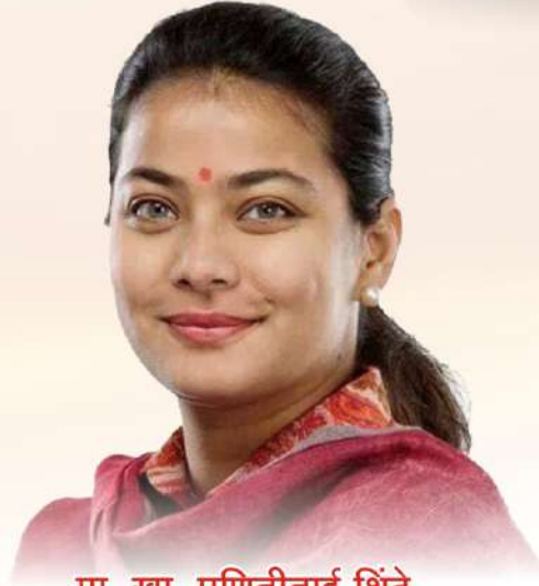
मा. खा. प्रणितीताई शिंदे सोलापूर लोकसभा