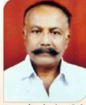
जमालपुरे सुमेरचंद्र हरिचंद